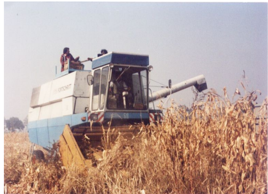
ELEKTRONIKUS PARCELLAMÉRŐ APAPTER ÜZEMI KOMBÁJNHOZ. AGROANALÍZIS TUDOMÁNYOS TÁRSASÁG ALL RIGHTS RESERVED!