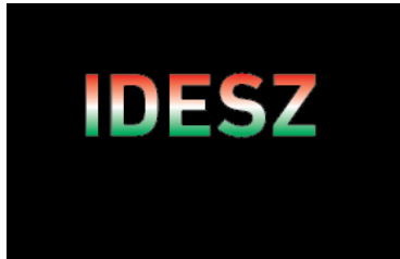
Idős Demokraták Szövetsége

Kedves csoporttársak, azt hiszem, nem vagyok egyedül, ha megállapítom: elégünk van. Elérkezettnek látjuk az időt, hogy az időskorúak érdekeinek védelme önállóan, politikai síkon is megjelenjen. Az Idős Demokraták Szövetsége alapítói az alábbi honlapon kitett közleménnyel jelzik megalakulási szándékukat. Amennyiben a csoporttársak közül valaki részt kíván venni a munkában, a honlapon feltüntetett email címen tudja jelezni. (info@idesz.hu) A további eseményekről is tájékoztatni fogjuk a csoport tagjait.