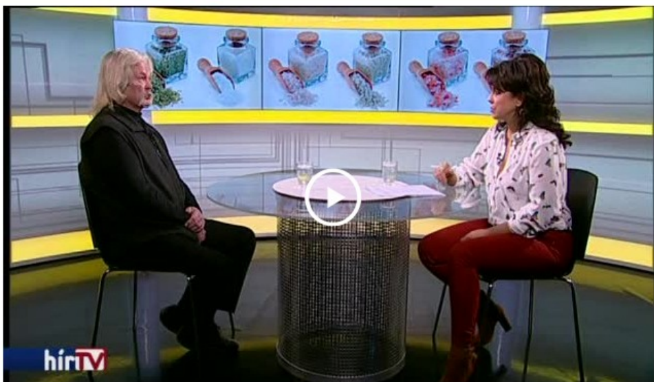
A Panaszkönyv február 6-i adása.