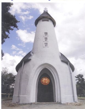
Kárpát-Haza Temploma, Verőce

Mottó 1: A környezeti és étkezési változtatások hatásait vélelmek helyett, a pontos mérési adatok tényleges jelentésén és helyesen vonatkoztatásán alapuló, mindenváltozós ANTIRANDOM hatáskalibrálás kell!