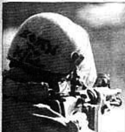
„Őt ki szeltem” – zsidó sisakfelvétel