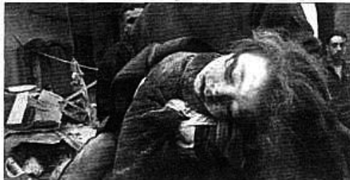
És íme egy áldozat...