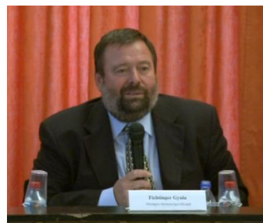
Hatóság képviselője válaszol a feltett kérdésre (2012.10.04-i közmeghallgatáson készült felvétel)